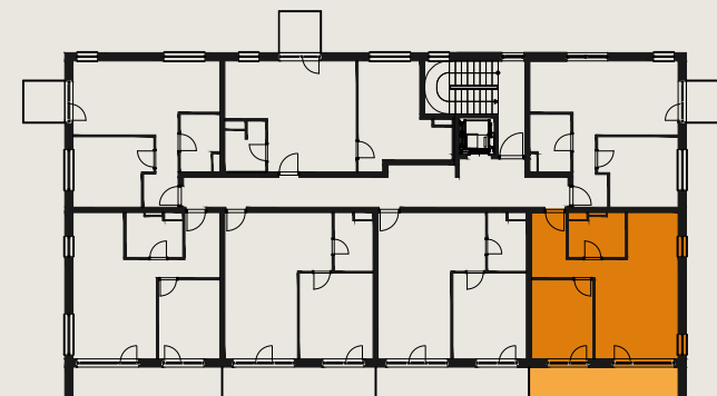
s c h é m a p ô d o r y s u 4 . N P / s c h e m e o f t h e t h i r d f l o o r